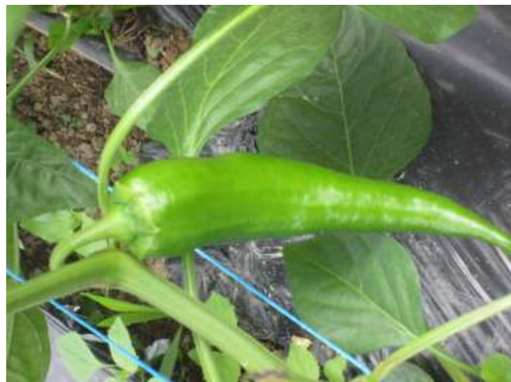
Les poivrons qui garniront bientôt vos paniers